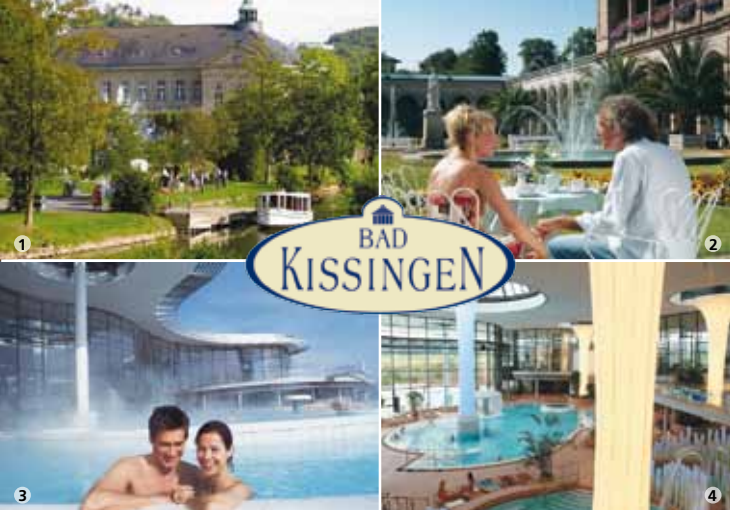
Foto 1 + 2 (c): Flavio Burel (www.novarte-fotodesign.de) - Foto 3 + 4 (c): KissSalis Betriebsgesellschaft mbH