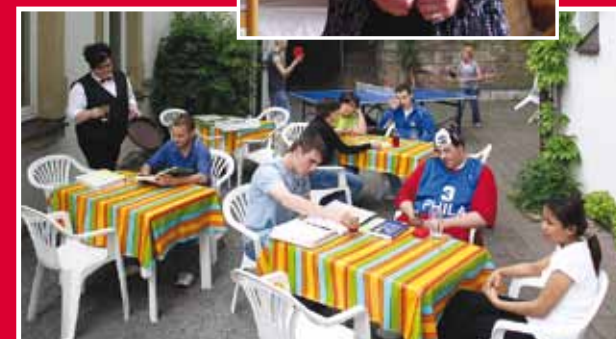
Ausreichend Platz an der Sonne finden Sie rund um unser Haus.